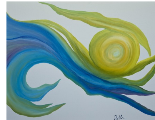
Francesca Cristiana Ciolli Oceano 2011 Olio su tela, 80X100

Comprendere l'opera di Omar Salvagno significa scoprirne la poetica sottintesa, ripercorrere il viaggio di formazione dal quale scaturiscono le architetture e le figure femminili protagoniste. Le donne di Salvagno, ora muse sensuali, ora divinità mitologiche marine nascono da un mondo onirico e accompagnano lo scultore in una peregrinazione ideale attraverso la storia, il mito, l'arte. Nelle sculture che raffigurano architetture l'artista trae spunto dai luoghi visitati, come "Baith al Hassan", di sapore orientale, oppure dall'arte del Novecento, come "Il sogno di Ebdòmero", che raggiunge un misurato equilibrio tra atmosfera metafisica e rigore razionalista.