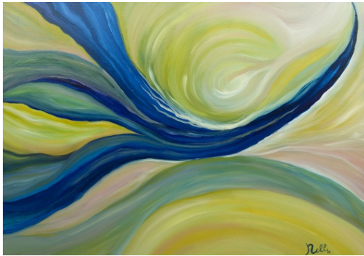
Francesca Cristiana Ciolli Oltre 2011 Olio su tela, 50X70