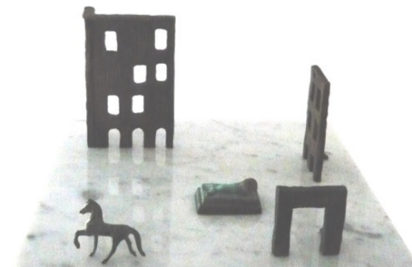
Omar Salvagno Il sogno di Ebdòmero 2010 Bronzo, marmo di Carrara