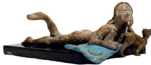
Omar Salvagno Simone et le chat II 2008 Bronzo, portoro di Portovenere