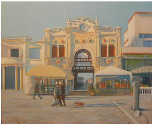
Luca Paparo Balena 2011 Olio su compensato, 50X60